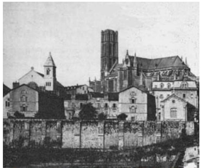
L'abbaye en 1910