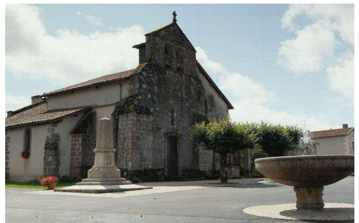
Eglise de St-Yrieix-sous-Aixe aujourd'hui