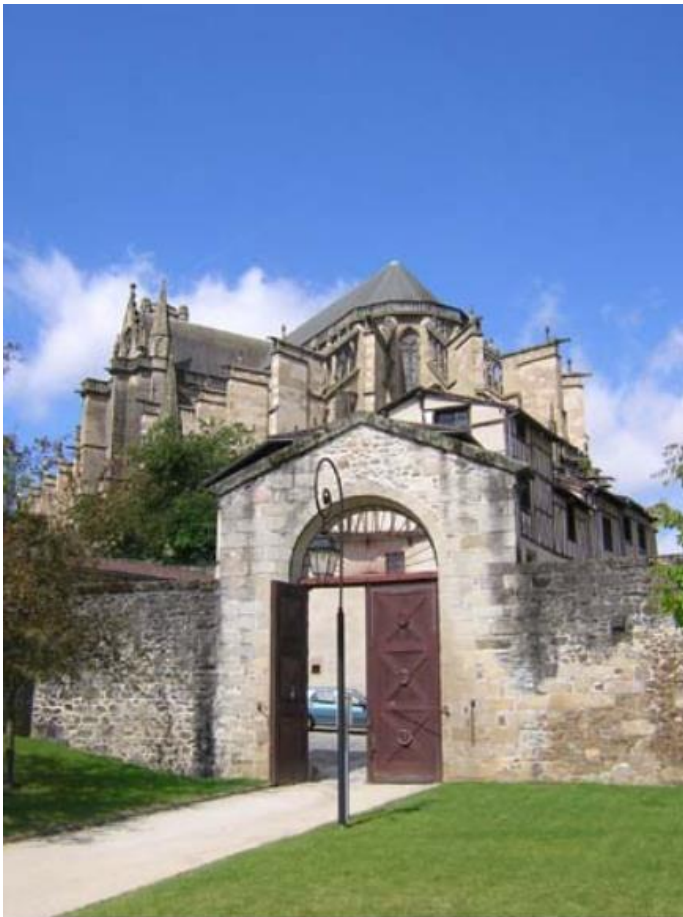
Le quartier de la Règle Le portail XVIIIe seul vestige.