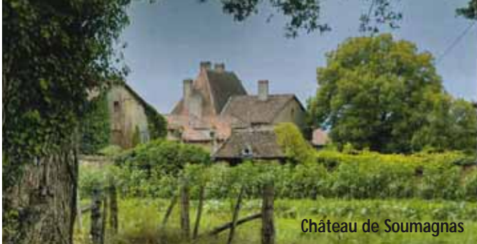
Château de Soumagnas

6 Traverser la RD, prendre en face la route du Mas Buisson. A la sortie du village, suivre le chemin Jusqu'à la route.