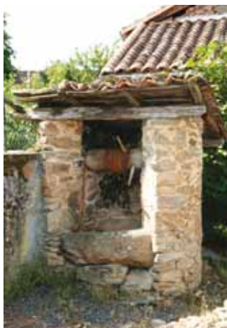
Puits à la Thiverie

10 A la Chatonette, prendre le chemin en terre qui descend dans la forêt. Traverser la RD699, et 20 m à gauche, descendre les marches et se retrouver en bordure de l'étang de pêche de Gorre. Le contourner par la gauche et rejoindre le point de départ à l'église.